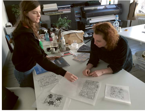
De techniek om herhaalpatronen te tekenen en om te zetten in geschilderde presentatietekeningen wordt bijna niet meer toegepast en dreigt hierdoor te verdwijnen. CCO