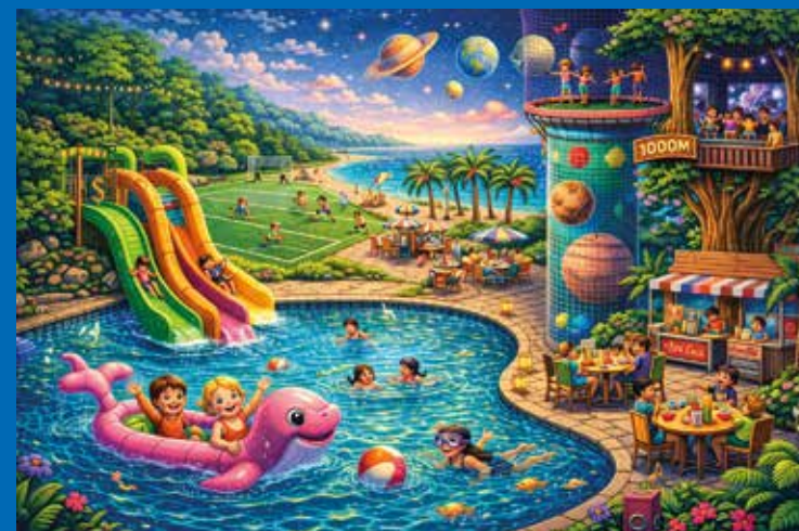
Oscar: "Dit is de leukste schrijfsels van de wereld."