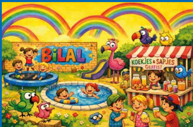
Bilal: "Ik ben blij met die mooie speelplaats en ik heb leuk kunnen schrijven."