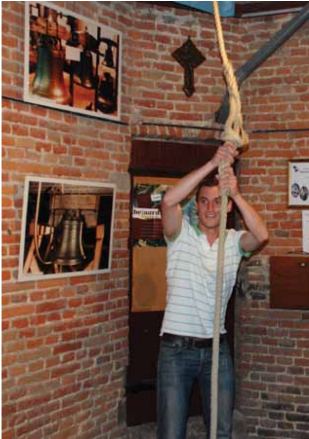
■ Laat de klokken luiden – Roeselaarse Klokkengilde Foto: Erfgoedcel TERF, 2012