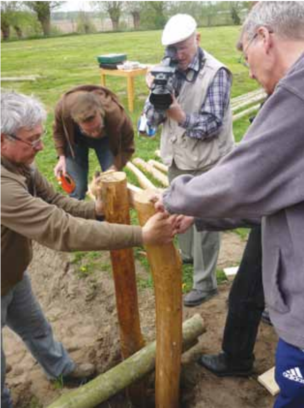
■ Aanleg van een krulbolbaan Foto: Erfgoedcel Meetjesland, 2011