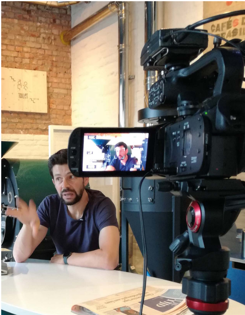
CAG maakte zelf twee filmpjes die het ambacht van de koffiebrander moeten introduceren bij een breed publiek.