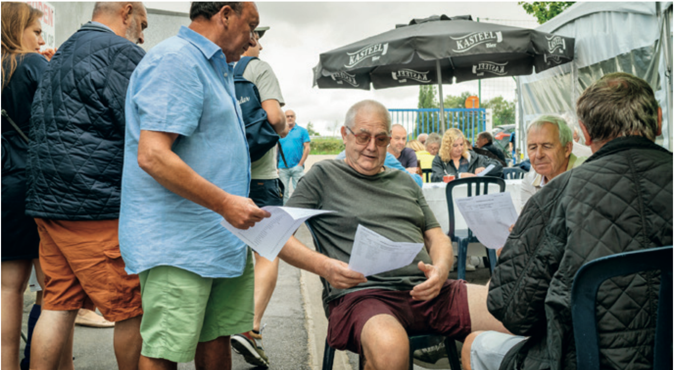
De spelers controleren de uitslagen en kunnen eventueel het resultaat aanvechten. Dit keer bestond de prijs uit €8 en een pakje boter voor de winnaar. Zijn vink, Pief, zong 558 liedjes.

we contact en in moeilijke tijden helpen we elkaar. Om maar enkele voorbeelden te noemen: na mijn rugoperatie stond mijn beste vriend vinkenier elke morgen om zes uur aan mijn deur om mijn vogels te verzorgen, tijdens corona deed ik boodschappen voor de oudere leden die de deur niet uit durfden en tijdens de jaarlijkse mis voor overleden vinkeniers zit de kerk afgeladen vol met honderden leden die afkomen om samen het verlies te dragen. Die sterke sociale cohesie is misschien wel onze grootste kracht!”