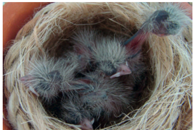
Een nest vinkenjongen

“Vogels opkweken is een engagement. Het is net als met kinderen, je bent er 24u per dag mee bezig,” vervolgt Gino Welvaert zijn verhaal. “Het houdt meer in dan de dagelijkse verzorging van je dieren. Vinkeniers spelen wedstrijden en willen gezonde, krachtige