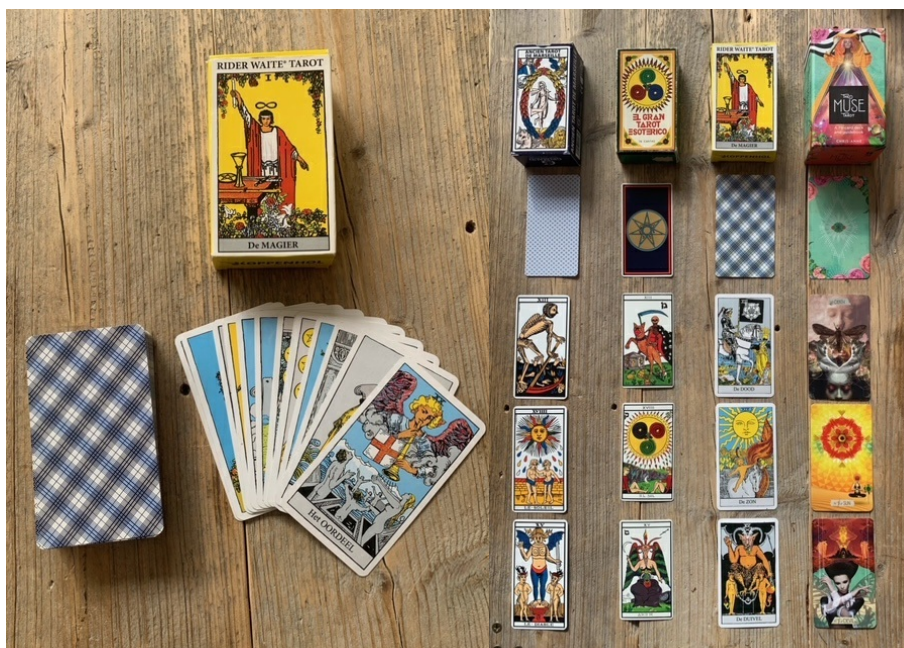
Afbeeldingen: de Rider Waite Tarot (links) en de de evolutie van de kaarten (rechts)

Hoeveel variaties er ook bestaan, de oorspronkelijke betekenis van een kaart blijft dus stabiel. Het is wel zo dat de tekeningen zelf wijzigen en dat je een ontelbaar aantal kaartendecks kan vinden. Je kan het zo gek niet bedenken of de kaarten bestaan: de figuren worden vervangen door meer hedendaagse karakters en zijn eigen interpretaties van de oorspronkelijke tekeningen, die soms op zich kunstwerkjes zijn geworden. Er zijn tegenwoordig kaarten in alle groottes, diktes en variaties te verkrijgen. De kaarten zijn dan ook soms echte verzamelobjecten geworden. De meest frequent gebruikte tarotkaarten tegenwoordig zijn die van de Rider Waite Tarot . Ze worden gezien als 'standaard'