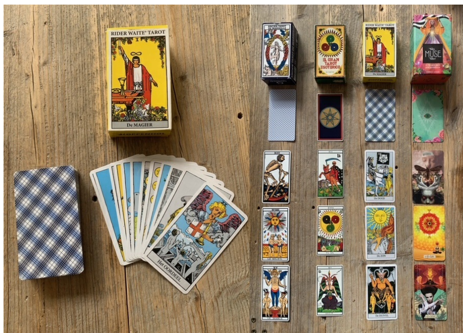
Afbeeldingen: de Rider Waite Tarot (links) en de de evolutie van de kaarten (rechts)

Hoeveel variaties er ook bestaan, de oorspronkelijke betekenis van een kaart blijft dus stabiel. Het is wel zo dat de tekeningen zelf wijzigen en dat je een ontelbaar aantal kaartendecks kan vinden. Je kan het zo gek niet bedenken of de kaarten bestaan: de figuren worden vervangen door meer hedendaagse karakters en zijn eigen interpretaties van de oorspronkelijke tekeningen, die soms op zich kunstwerkjes zijn geworden. Er zijn tegenwoordig kaarten in alle groottes, diktes en variaties te verkrijgen. De kaarten zijn dan ook soms echte verzamelobjecten geworden. De meest frequent gebruikte tarotkaarten tegenwoordig zijn die van de Rider Waite Tarot . Ze worden gezien als 'standaard'