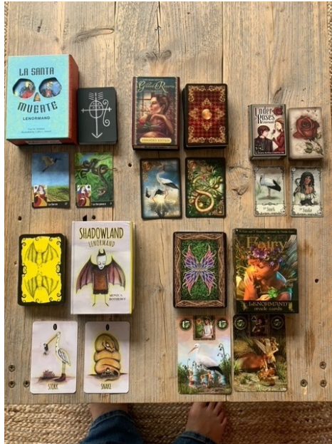
Afbeelding: voorbeeld van verschillende Lenormand kaartdecks

Je kan zelfs verschillende kaartmethododes met elkaar combineren indien je wil. Dat zie je meer en meer gebeuren. Het ligt nog altijd gevoelig dat je je niet bij één soort kaarten houdt en bijvoorbeeld een tarotlegging beëindigt met een orakelkaart. Maar je ziet dat meer en meer veranderen en diverse methododes worden samen gebruikt.