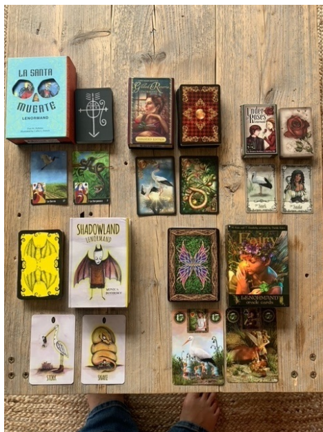
Afbeelding: voorbeeld van verschillende Lenormand kaartdecks

Ook de Lenormand kaarten kan je in steeds meer variaties vinden. Maar omdat deze vooral in onze streek worden gebruikt, is het aanbod beperkter. Toch zijn er een aantal leuke variaties te vinden.