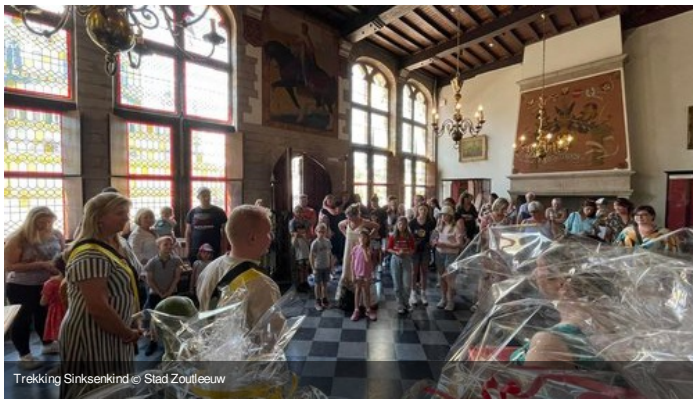
Trekking Sinksenkind