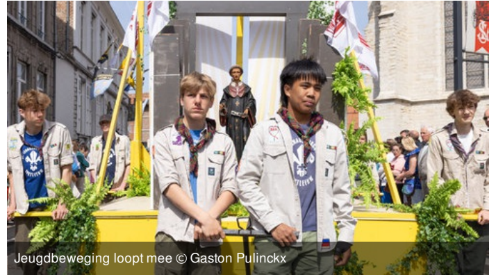
Jeugdbeweging loopt mee