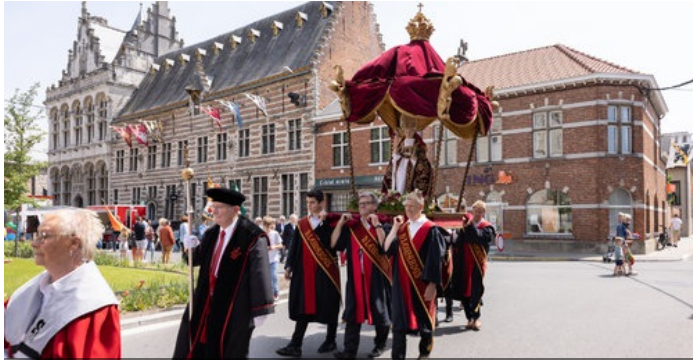
De schutspatroom in vol ornaat