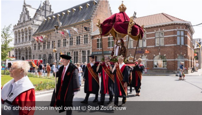
De schutspatroom in vol ornaat