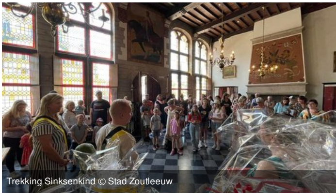
Trekking Sinksenkind