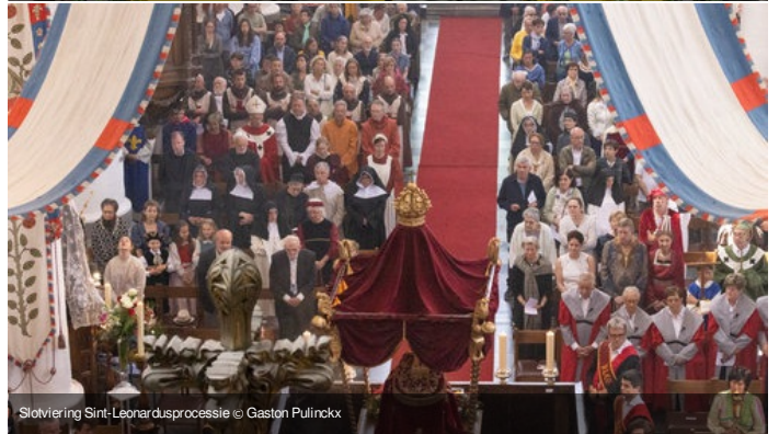
Sloviering Sint-Leonardusprocessie