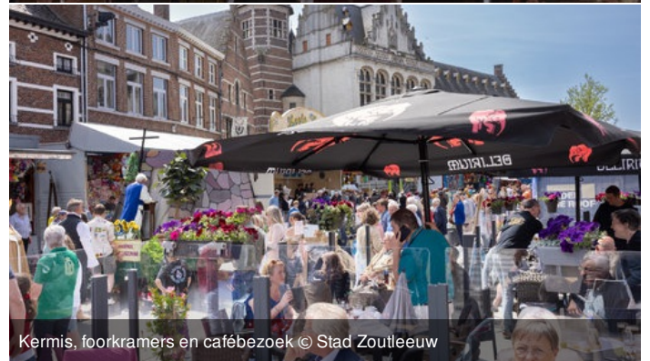
Kermis, foorkramers en cafébezoek