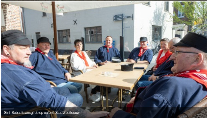
Sint-Sebastiaansgilde op café