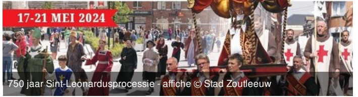
750 jaar Sint-Leonardusprocessie - affiche