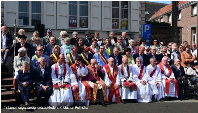
Tribune hoogwaardigheidsbekleders