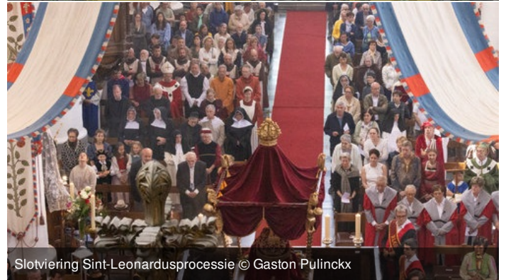
Slotviering Sint-Leonardusprocessie