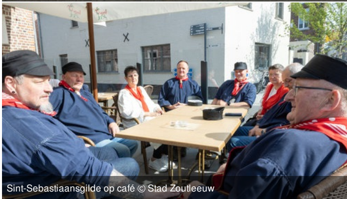
Sint-Sebastiaansgilde op café