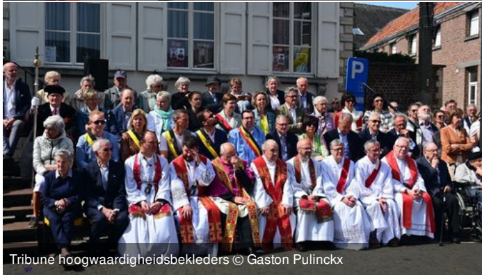
Tribune hoogwaardigheidsbekeders