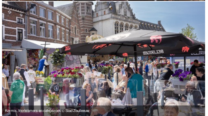
Kermis, toorkramers en cafébezoek