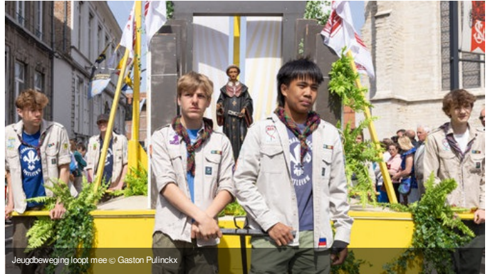
Jeugdbeweging loopt mee