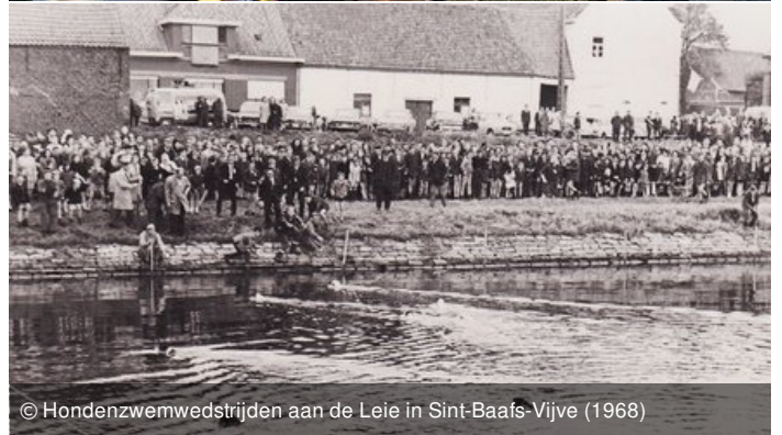
© Hondenzwemwedstrijden aan de Leie in Sint-Baafs-Vijve (1968)