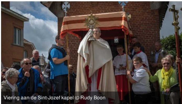
Viering aan de Sint-Jozef kapel