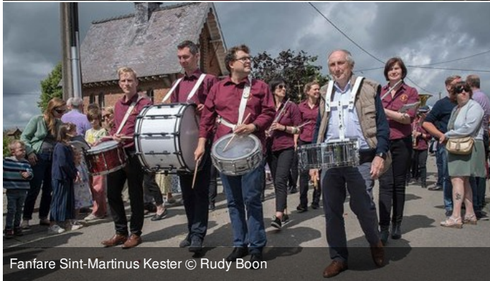
Fanfare Sint-Martinus Kester