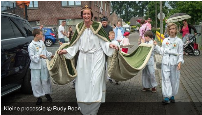
Kleine processie