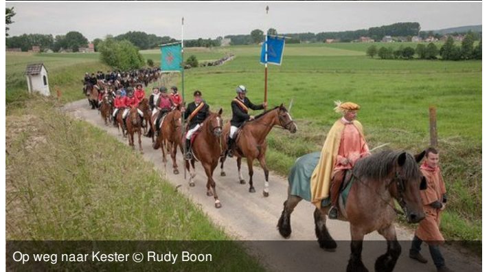
Op weg naar Kester