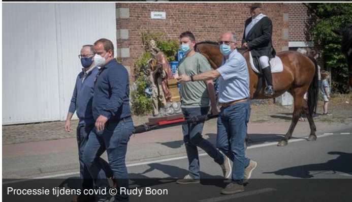
Processie tijdens covid