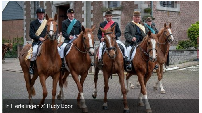
In Herfelingen