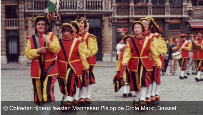
© Optreden tijdens feesten Manneken Pis op de Grote Markt, Brussel