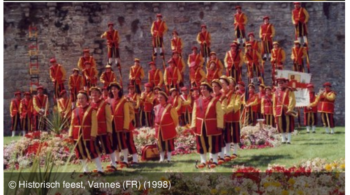
© Historisch feest, Vannes (FR) (1998)