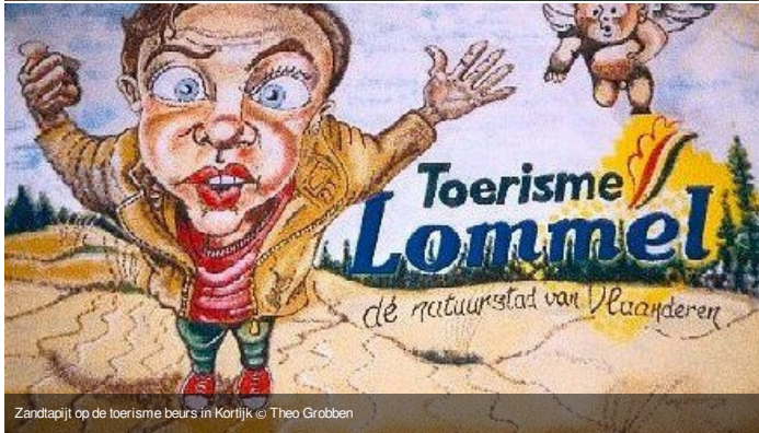
Zandaprijt op de toerisme beurs in Kortrijk