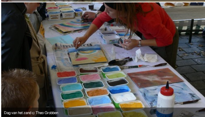
Dag van het zand