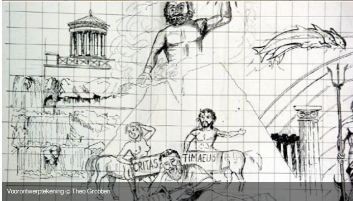
Voorontwerptekening © Theo Grobben