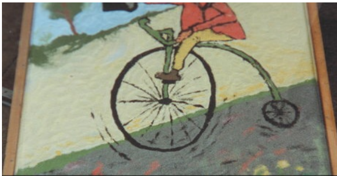
25 jaar zandaprijzen