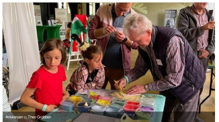
Antwerpen © Theo Grobben