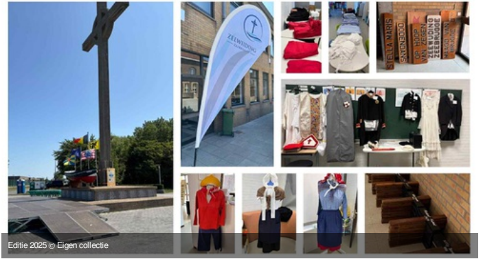
Editie 2025