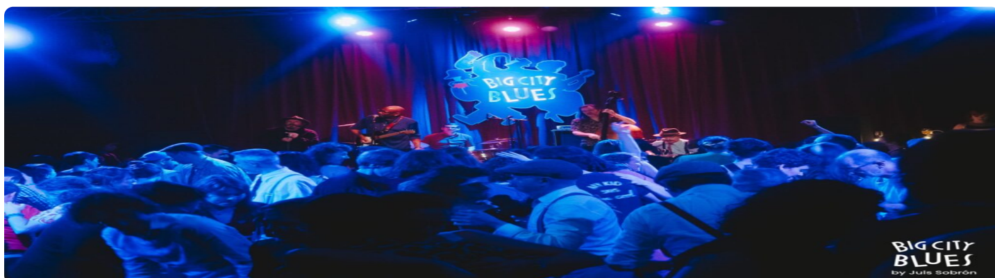
Bluesdansen in Vlaanderen