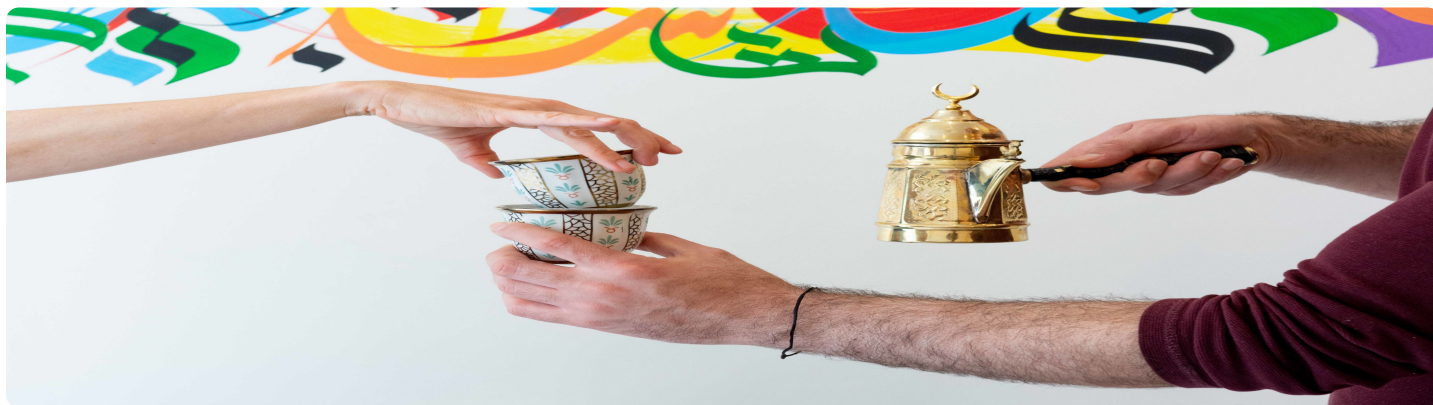
Syrische koffie: een welkomstkoffie